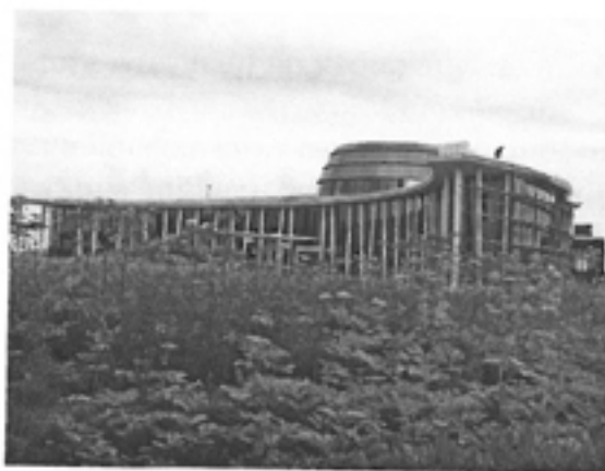
(2.attēls – Tukuma lidostas nesen no jauna uzbūvētā pasažieru termināļa ēka, fotouzņēmums izdarīts 2011.gada 14.jūlijā)