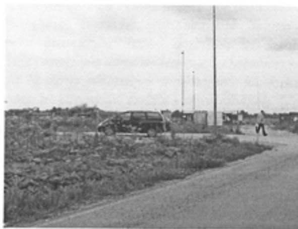
(4.attēls – Tukuma lidostas infrastruktūra izbūve joprojām turpinās, fotouzyņēmums izdarīts 2011.gada 14.jūlijā)