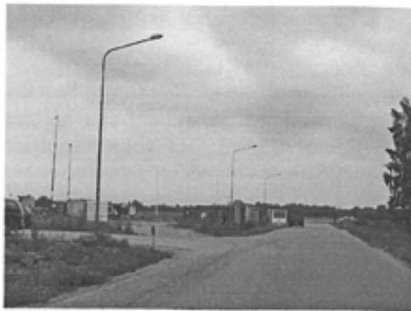
(3.attēls – Tukuma lidostas nesēn no jauna uzbūvētā infrastruktūra, fotouzyņēmums izdarīts 2011.gada 14.jūlijā)